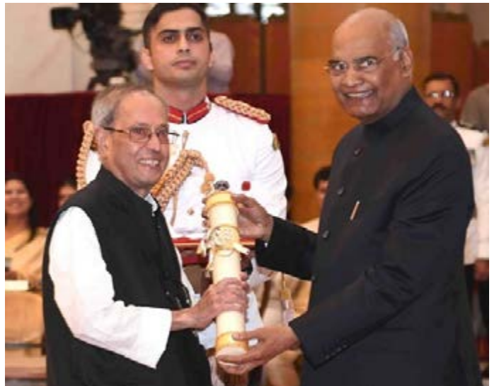
पूर्व राष्ट्रपति प्रणब मुखर्जी भारत रत्न से सम्मानित