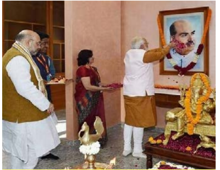
डॉ. श्यामा प्रसाद मुखर्जी को श्रद्धांजलि