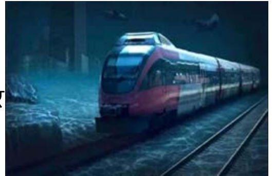
अंडर वॉटर ट्रेन