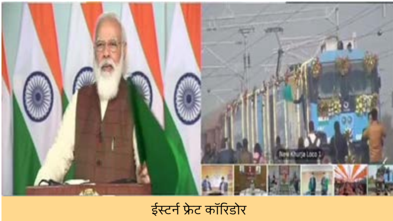
ईस्टर्न फ्रेट कॉरिडोर