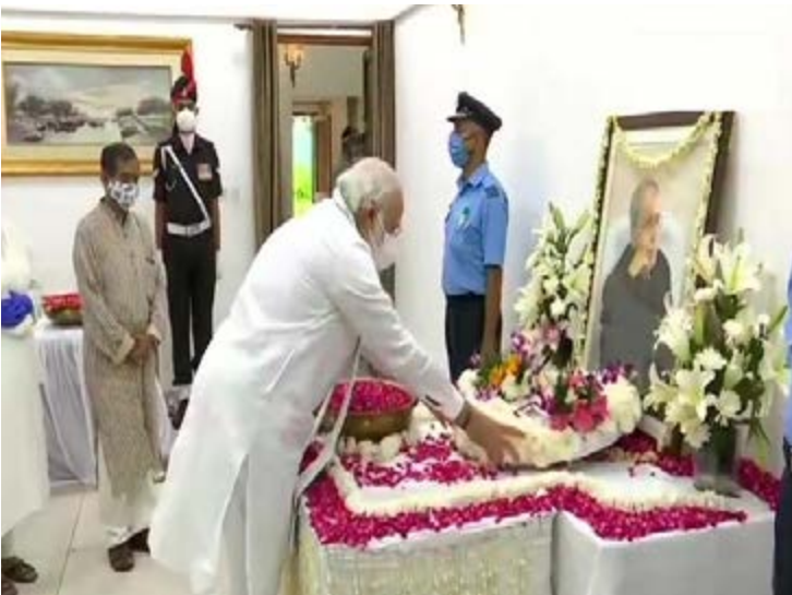
पूर्व राष्ट्रपति प्रणब मुखर्जी को श्रद्धांजलि