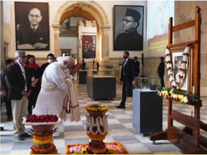
125वीं जयंती पर नेताजी सुभाषचंद्र बोस को श्रद्धांजलि