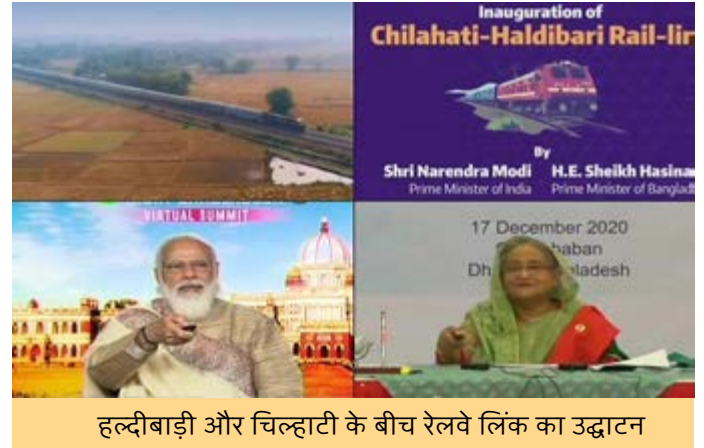
हल्दीबाड़ी और चिल्हाटी के बीच रेलवे लिंक का उद्घाटन