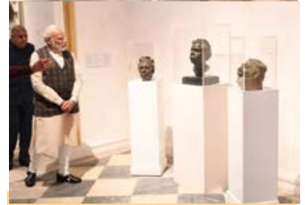
ओल्ड करेंसी बिल्डिंग