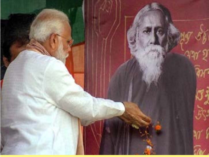
गुरुदेव रवींद्रनाथ टैगोर को श्रद्धांजलि