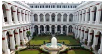
भारतीय संग्रहालय, कोलकाता