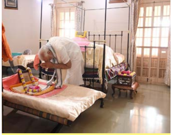
बेलूर मठ में स्वामी विवेकानंद को श्रद्धांजलि